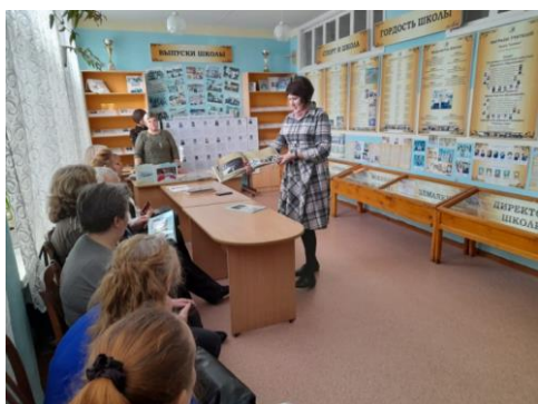
В музее истории школы «Эсперанто»