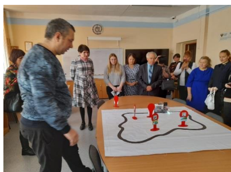
Демонстрация работы робота