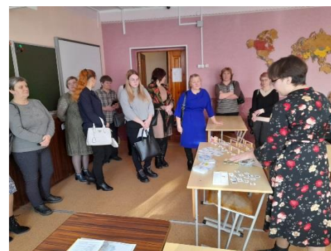
Представление проекта «Игровест»