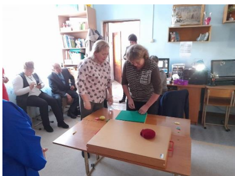
В сенсорной комнате