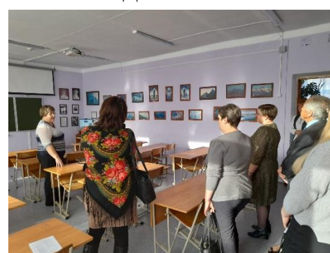
Экспозиция картин Рериха