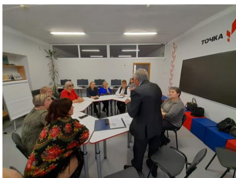
Круглый стол МО краеведов