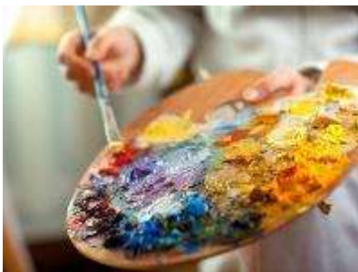
Механическое смешение цвета