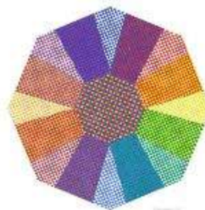
Оптическое смешение цвета